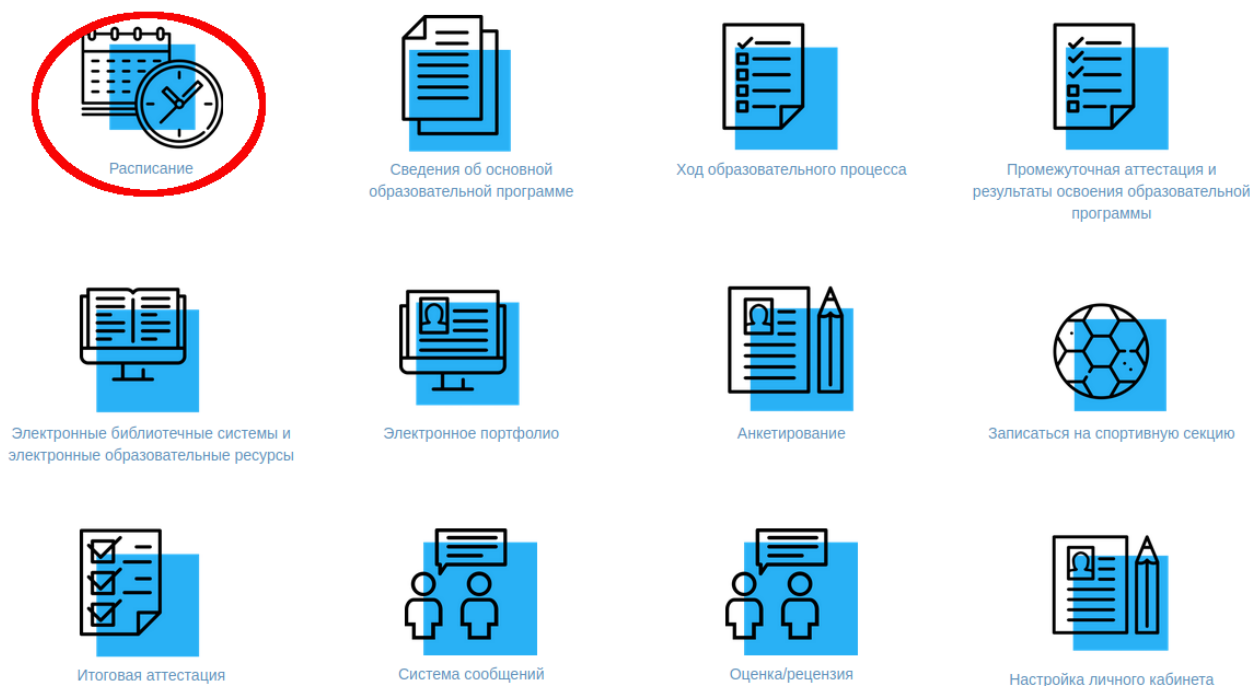
Рисунок 3 — Переход на расписание

После этого необходимо выбрать пункт «Расписание» и осуществится переход на расписание с функционалом просмотра методических рекомендаций.