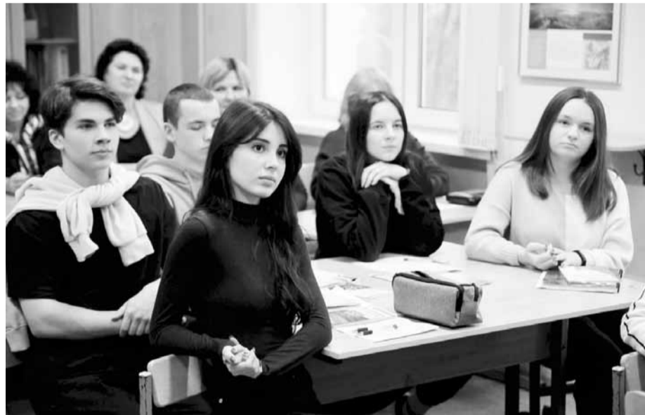
Роль профсоюзов в современном обществе обсудили на занятии в школе №1522

буквально по крупинкам, к концу урока стала их полноценным знанием. Кроме того, очень важно, чтобы эти ребята нашли для себя в Сети информацию по профсоюзному движению, переработали ее и пришли с вопросами к своему учителю. Уверена, эти школьники в ближайшей перспективе станут нашими союзниками и единомышленниками!