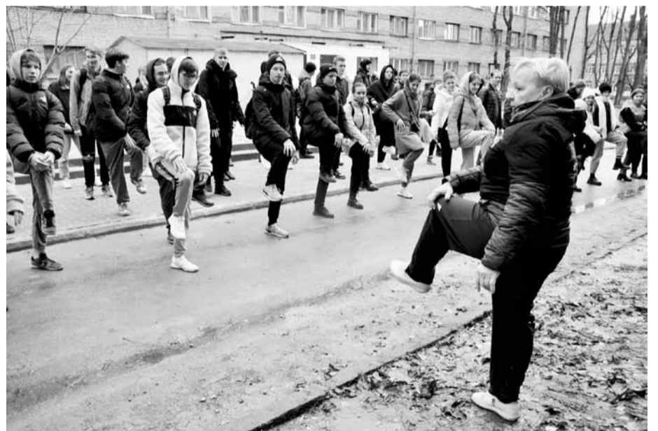
Фестиваль начался с зажигательной зарядки