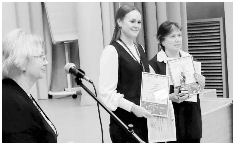
Победители в номинации «Две звезды»