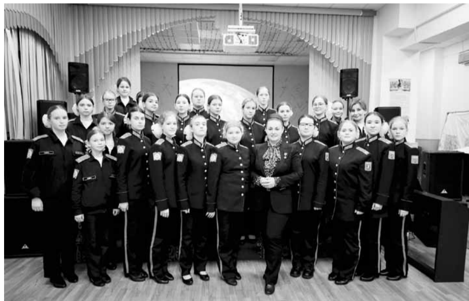
Почетным гостем профсоюзного урока в кадетской школе Первого московского кадетского корпуса стала Герой России летчик-космонавт Елена СЕРОВА

Слова приветствия и благодарности школьники услышали от почетных гостей урока - учителей и представителей профсоюзной организации специализированной