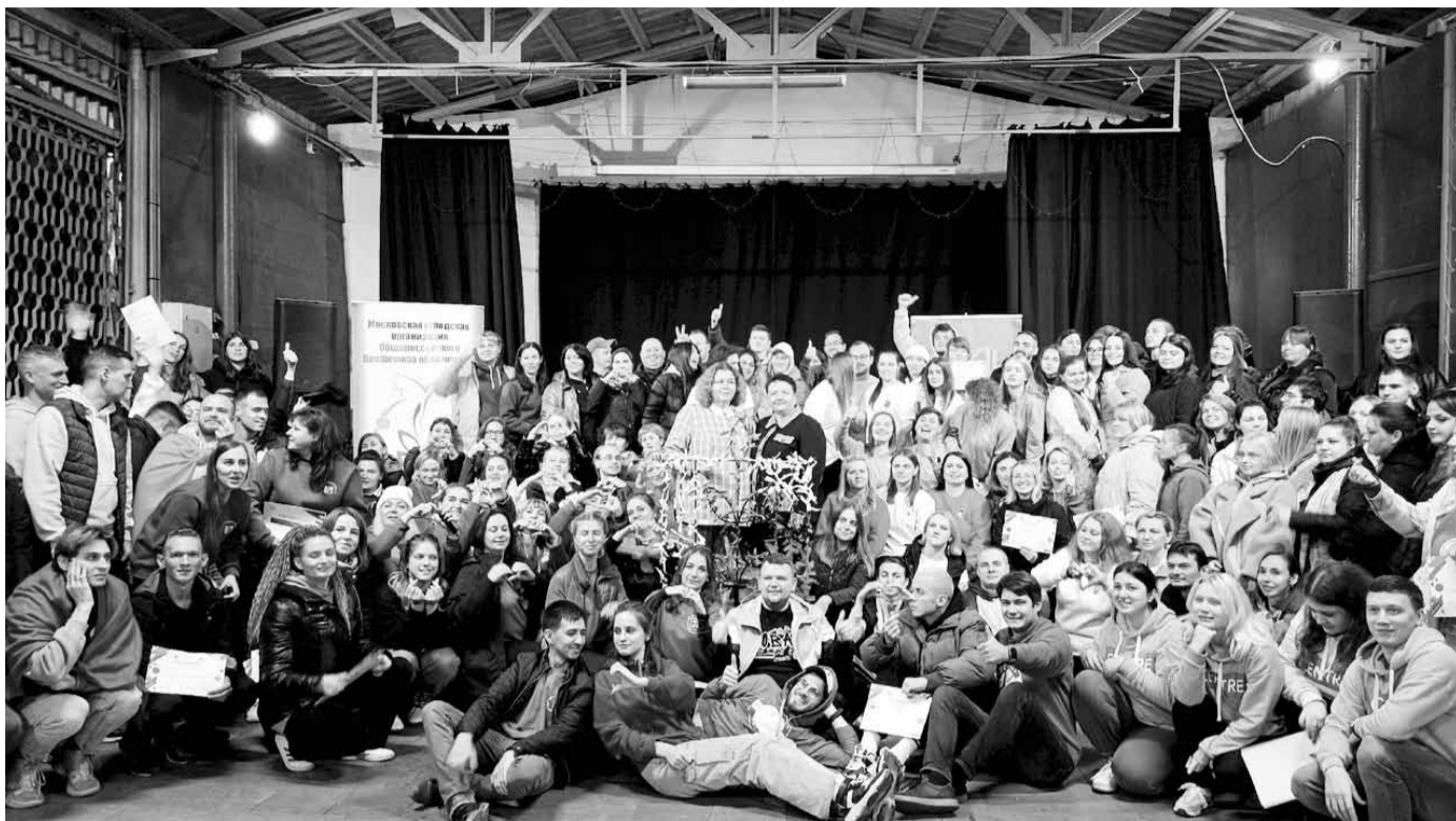
Форум собрал участников из 16 регионов