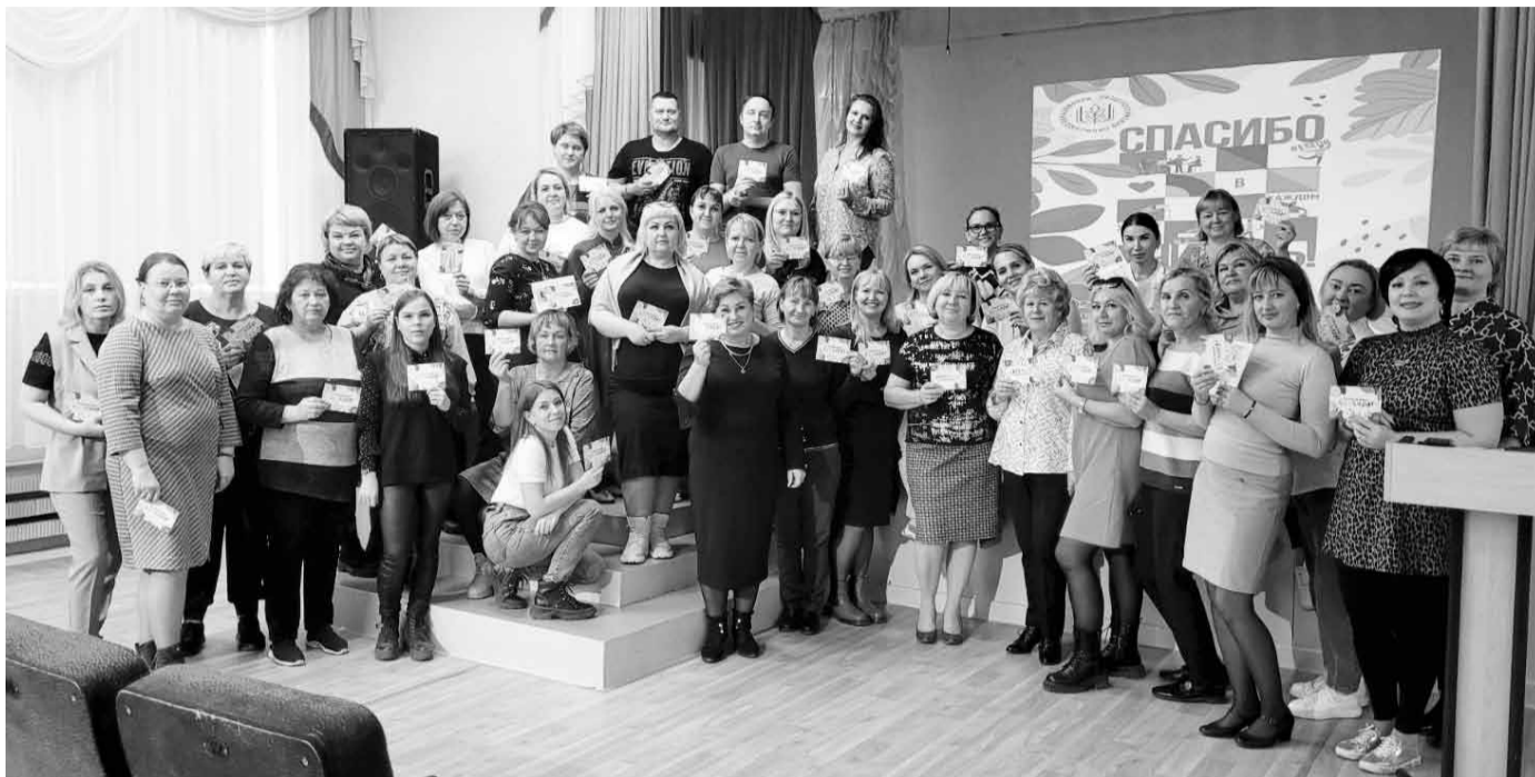
На совещании по профсоюзному наставничеству

Для каждого наставляемого разрабатывается индивидуальная «дорожная карта», которая может корректироваться наставником в процессе работы.