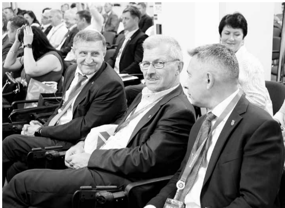
Представителям профсоюзных техинспекций было что обсудить на своей конференции

- Сегодня при подготовке всех нормативно-правовых актов задействованы три стороны социального партнерства: государство, профсоюзы и работодатели. И при принятии каждого документа, от федеральных законов до приказов, мы стараемся учесть все аспекты и услышать каждую сторону. «Регуляторная гильотина», которая сегодня упоминалась, сыграла значительную роль при принятии нормативно-правовых актов на достаточно короткий период. Все-таки практика показала, что наличие такого