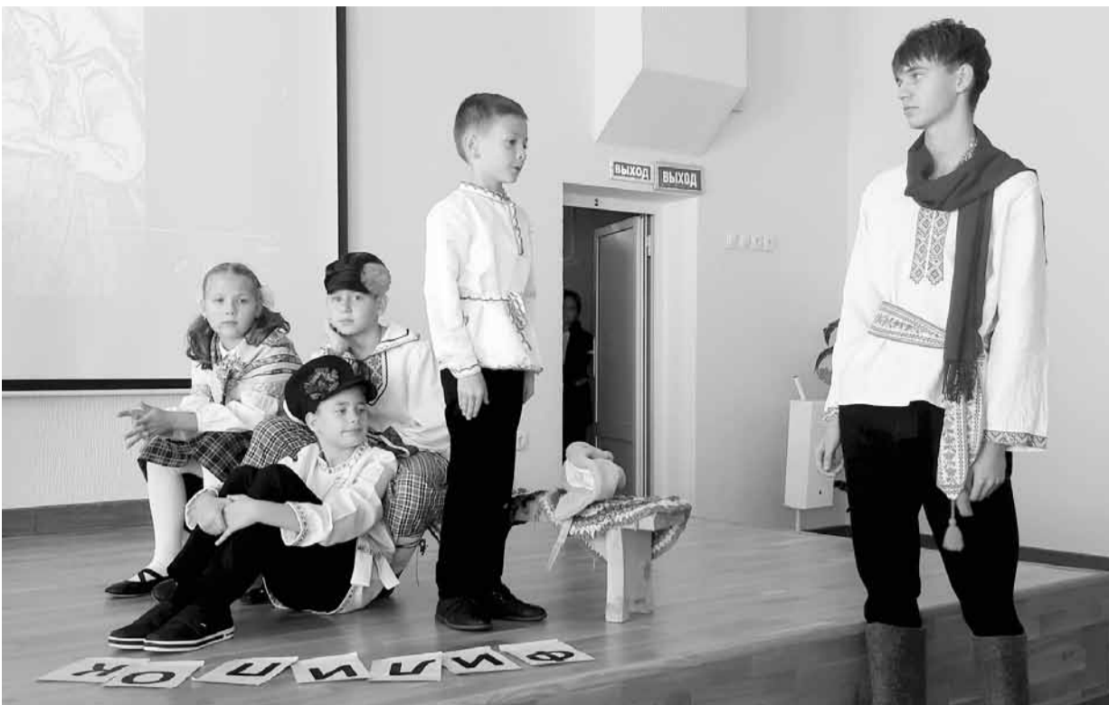
Ученики центра образования №53 разыграли по ролям рассказ «Филипок»

Вот и Толстовский урок был задуман с целью помочь педагогам узнать что-то новое, стать компетентнее. И, конечно, показать себя, поделиться бесценным опытом. Все уроки, продемонстрированные на фестивале, были связаны с жизнью и творчеством великого классика. Счастливые третьеклассники центра образования читали рассказ «Лев и собачка». Десятиклассники на внеурочном занятии посмотрели на биографию Льва Николаевича как на наглядное отражение истории России и нравственного состояния русского общества во второй половине XIX - начале XX века. «Мой земляк - Лев Николаевич Толстой» - так назывался урок для 11-го класса. Педагоги, дающие уроки