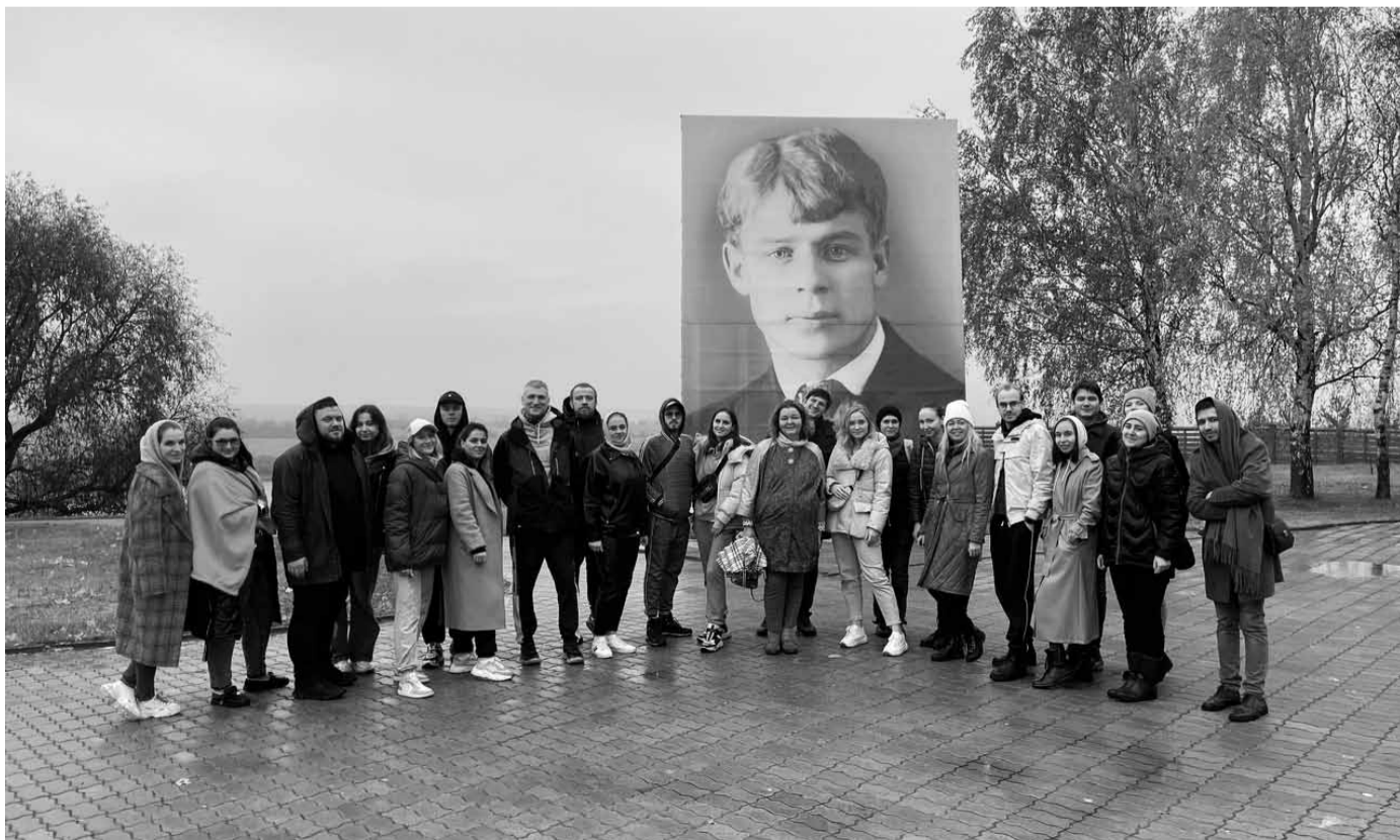
В селе Константиново

Одним из ключевых событий форума стал IX автопробег молодых педагогов, посвященный Международному дню учителя и Всемирному дню действий профсоюзов «За достойный труд».