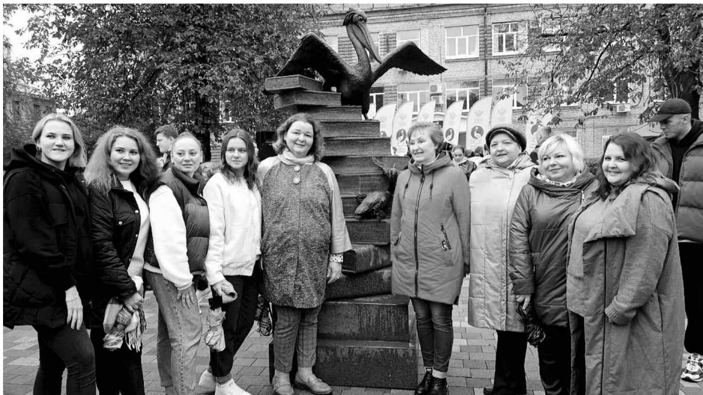
На церемонии открытия скульптурной композиции, посвященной учителям

- За годы своего существования форум стал замечательной площадкой для общения активных, ищущих, желающих двигаться вперед молодых педагогов. Для нас большая честь и огромная ответственность принимать у себя коллег из других регионов в Год педагога и наставника. Мы постарались подготовить не только интересную