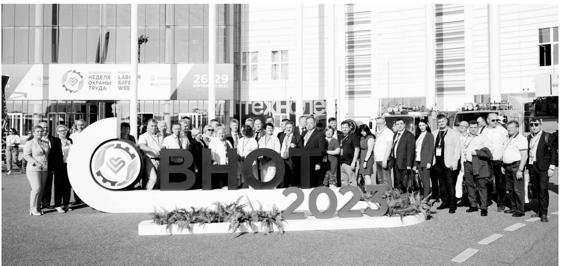
Представители профсоюзов на ВНОТ-2023

- Если не мы с вами, то кто? Демагогии и демократии в охране труда быть не может. Потому что невыполнение правил техники безопасности приводит к травме или того хуже. Охрана труда, безопасность на производстве - важнейшее направление нашей