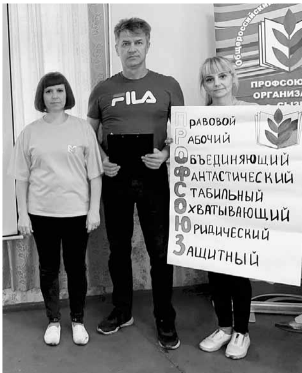
Таким участники смены видят профсоюз