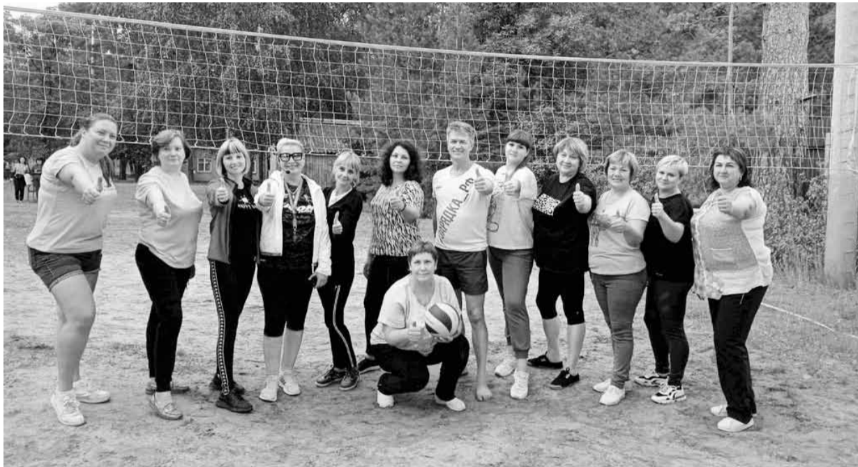
В свободное от учебы время педагоги участвовали в спортивных соревнованиях