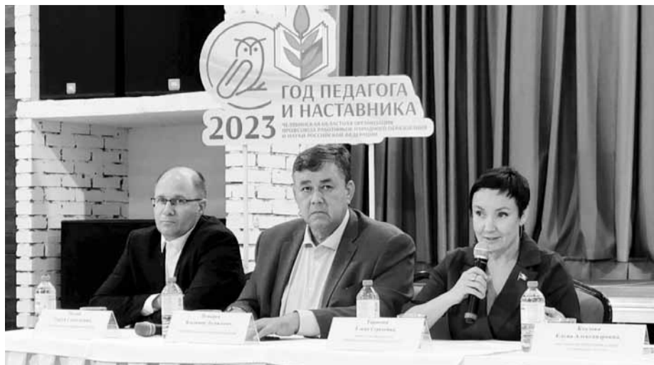
Разговор без галстуков

В дискуссии коснулись единого содержания рабочих программ общего образования,