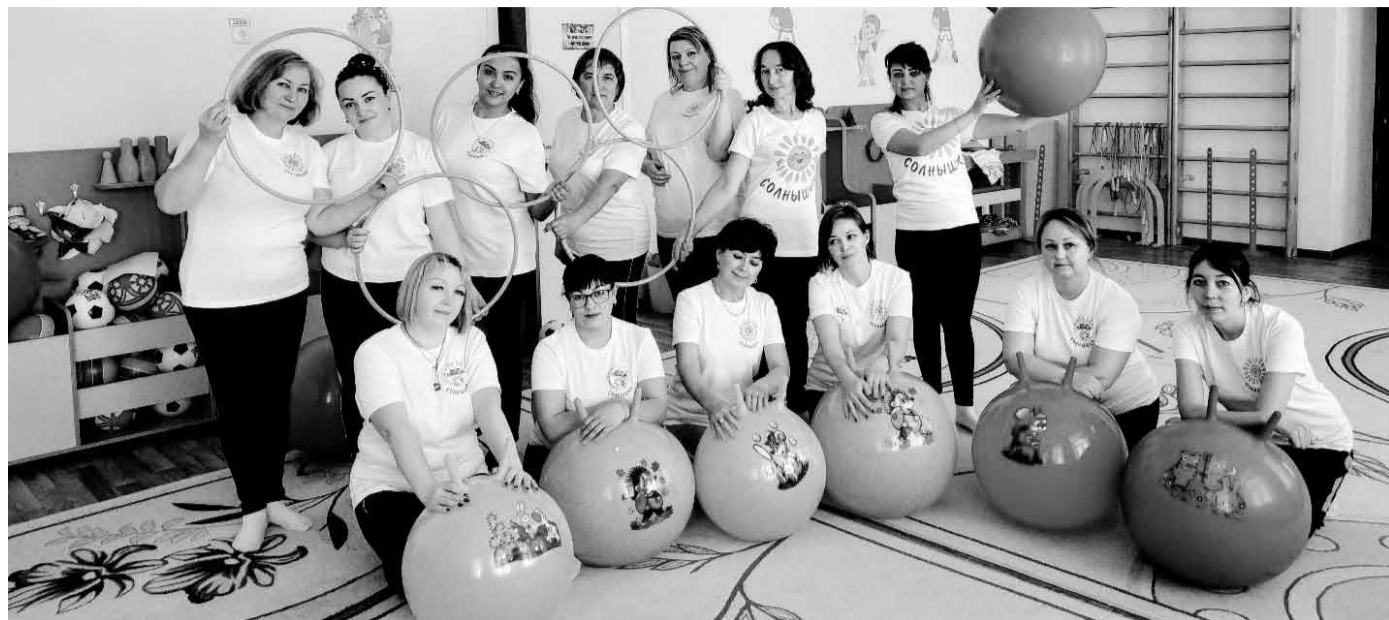
Для занятий спортом в садике созданы все условия

Детский сад «Солнышко» села Юмагузино Кугарчинского района Башкортостана вошел в число победителей регионального этапа конкурса «Российская организация высокой социальной эффективности». Коллектив занял I место в номинации «За формирование здорового образа жизни в организациях непроизводственной сферы», и не случайно. Благодаря корпоративной программе, которую реализуют в дошкольном учреждении, для многих педагогов спорт стал неотъемлемой частью жизни.