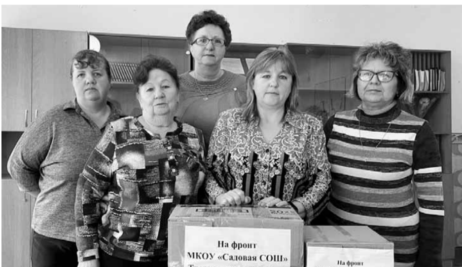
Посылки на фронт от коллектива Садовой средней школы Третьяковского района