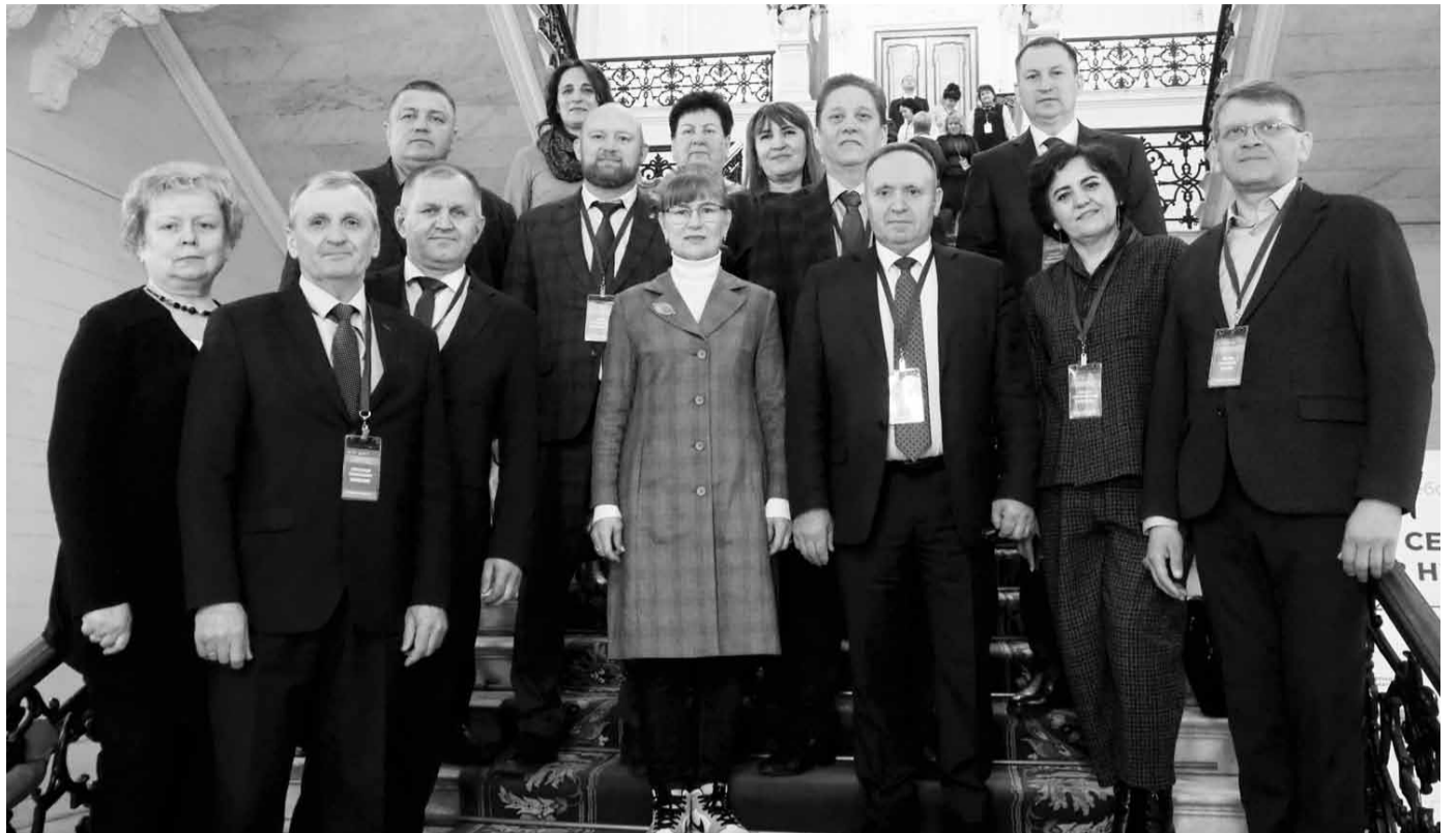
Встреча во Дворце труда

Для открытия стажировки было выбрано уникальное место - Николаевский дворец, который когда-то служил резиденцией великого князя Николая Николаевича, а с 1918 года перешел в распоряжение профсоюзов и теперь известен во всем мире как Дворец труда. Впрочем, многие школы, гимназии, лицеи города находятся в зданиях, имеющих историческую ценность. Такое «бытие» в историческом антураже, как показывает практика, определяет сознание и педагогов, и учеников. Но, несмотря на любовь к истории и умение сохранять традиции, образовательная система Санкт-Петербурга задает тон и формирует тренды инновационного развития.