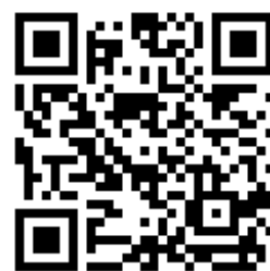
Кафедра ИБ в ВК