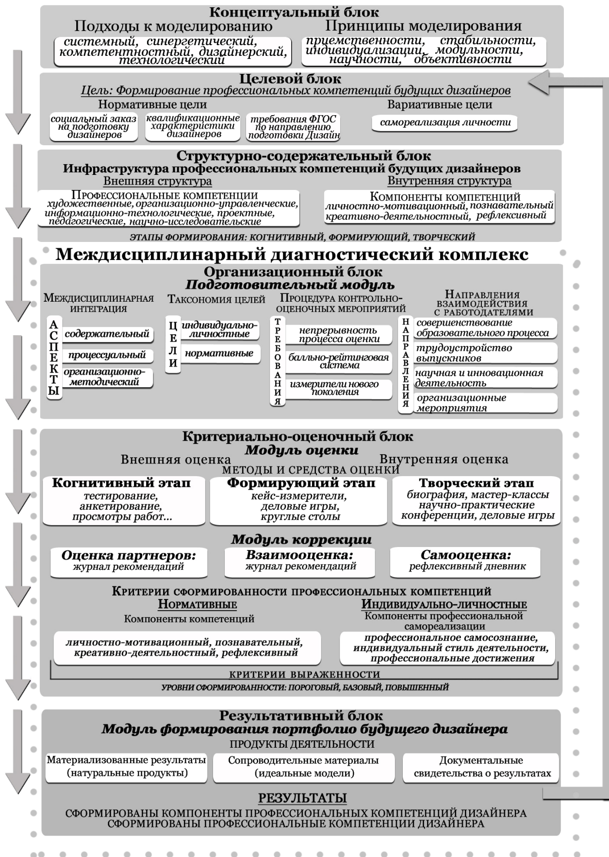
Рисунок 1 - Теоретическая модель формирования профессиональных компетенций будущих дизайнеров с включенным в ее структуру междисциплинарным диагностическим комплексом