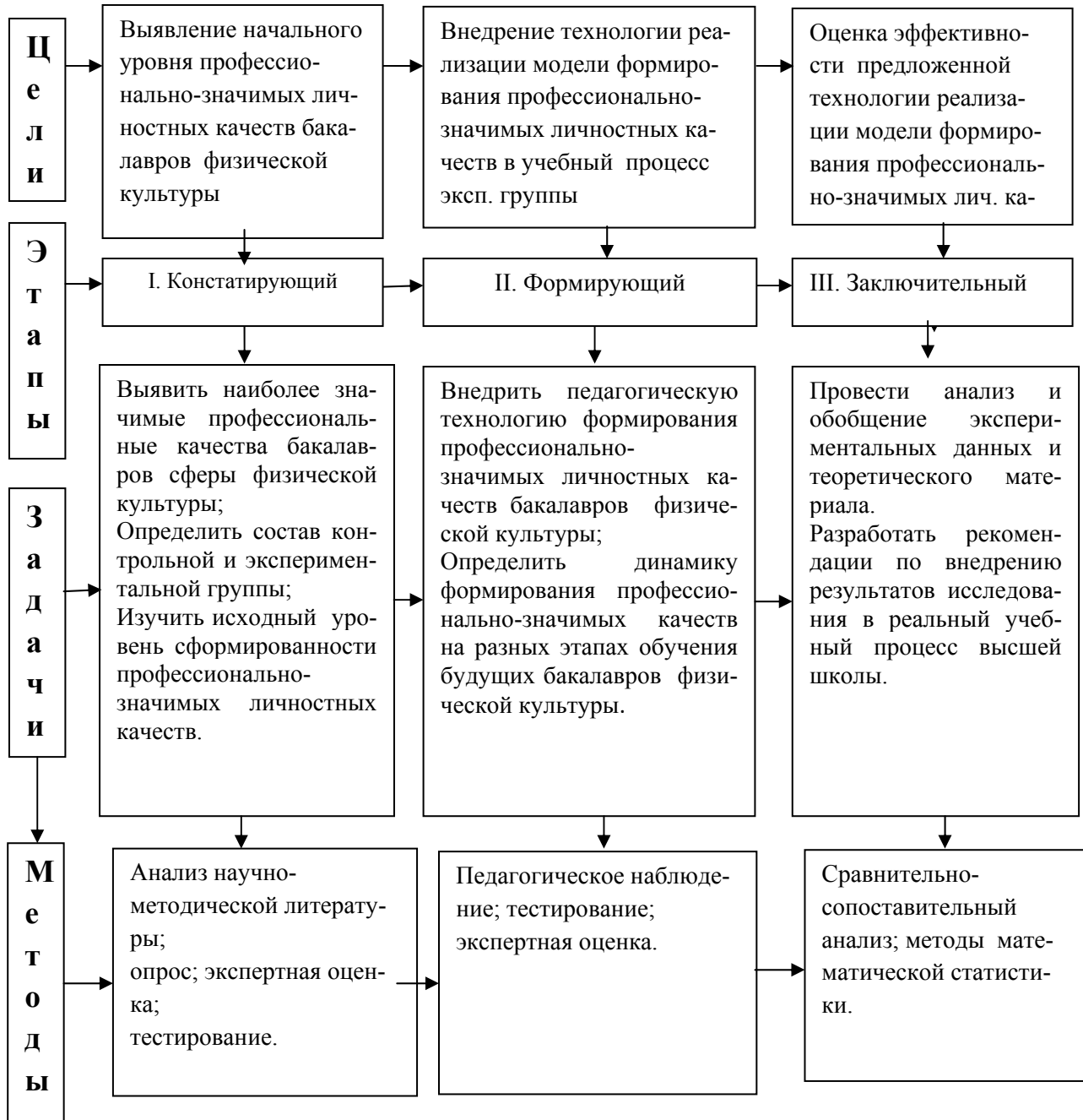
Схема – 3. Программа формирования профессионально значимых личностных качеств и внедрения ее результатов в профессиональную деятельность бакалавров сферы физической культуры.