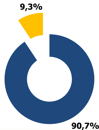
Доля ПАО «Мосэнергосбыт» в московском регионе