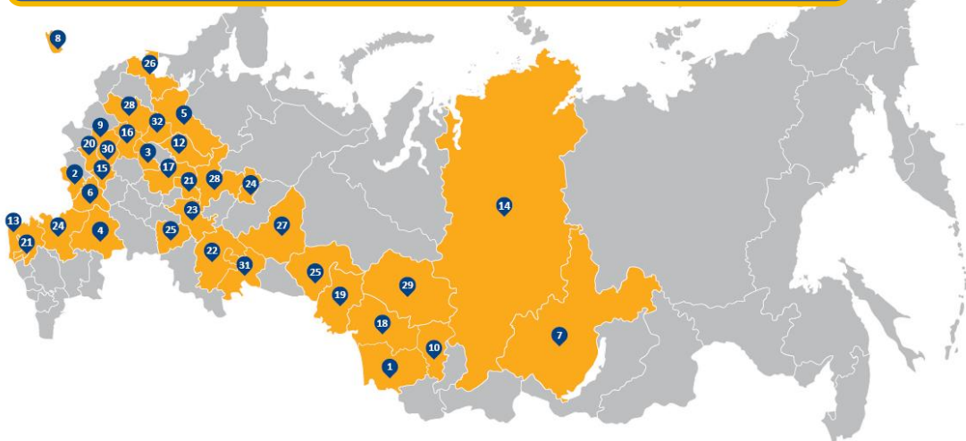
Регионы присутствия ПАО «Мосэнергосбыт» в России