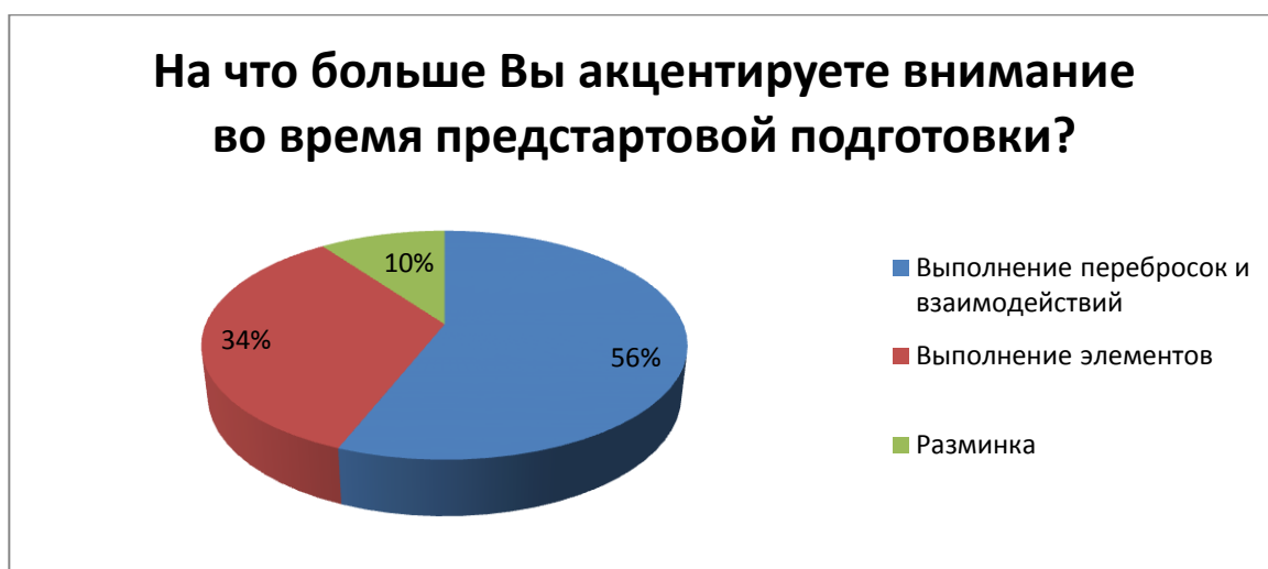
Рис. 3. Распределение времени на выполнении технических элементов

«Предметной» разминке большая часть респондентов, уделяет 15% времени от общей разминки. Во время предстартовой разминки 56% респондентов акцентируют внимание на выполнение перебросок и взаимодействий, 34% на выполнение элементов и 10% на разминку рис.3.