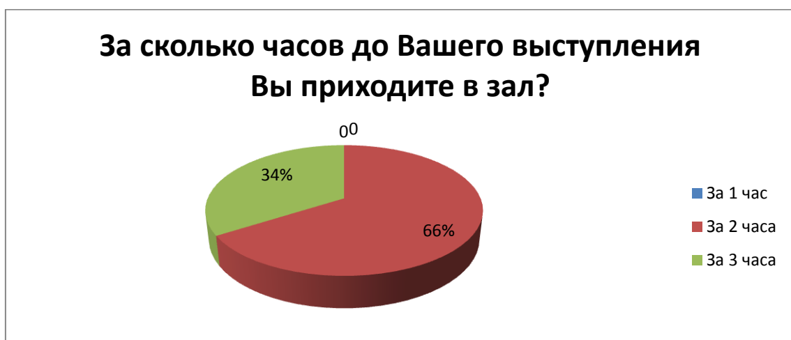
Рис.1. Время прихода спортсменок зал до начала соревнований

В результате беседы со спортсменами, а также на основе проведенного анкетирования были сделаны выводы о проведении предстартовой подготовки в день соревнований (рис 1).