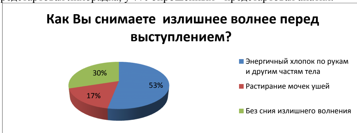
Рис. 4. Характеристика приемов снятия излишнего волнения

Также специалисты отмечают, что целесообразно иметь опробованный и эффективный ритуал настройки на выступление: идеомоторная тренировка, дыхательные упражнения, различные мелкие движения руками или ногами и т.д. По результатам исследования выявлено предстартовое состояние 70 % респондентов – боевая готовность, для 23%-характерна предстартовая лихорадка, у 7% опрошенных - предстартовая апатия.