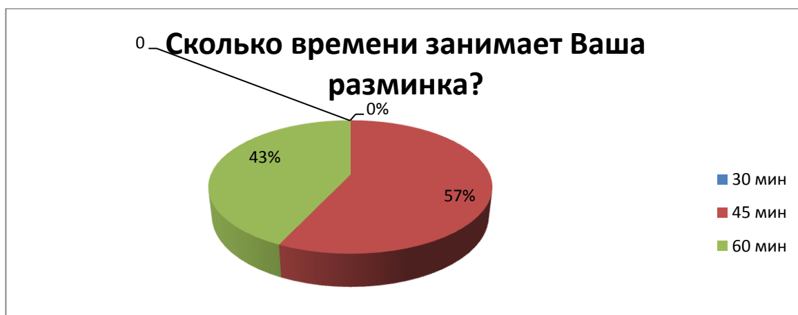
Рис.2. Ответы спортсменов о временных характеристиках разминки

Мнения спортсменов по поводу длительности разминки разделились. 57% опрошенных считают, что она должна продолжаться 45 мин, а 43% - 60 мин. (рис. 2).