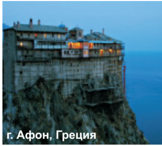
г. Афон, Греция

1000-летие с возникновения монастыря на Афоне. Это знаменательное событие должно объединить всех православных верующих. Примечательно, что все подготовительные работы взвалили на себя православная церковь. Эта страница в истории соединила навек две страны: Грецию и Россию. Поэтому будущий год также станет перекрестным годом этих двух стран.