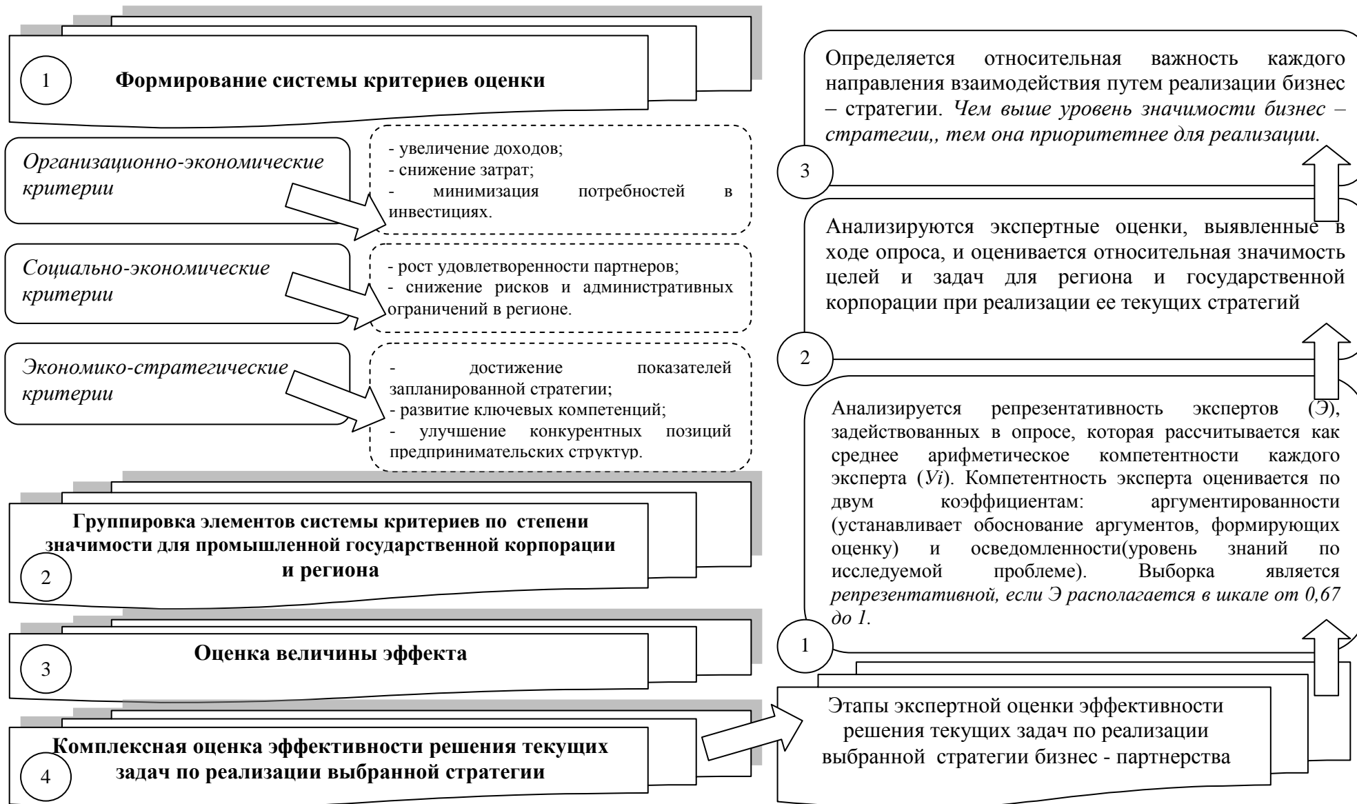
Рисунок 4 - Выделенные этапы оценки эффективности реализации выбранной хозяйствующим субъектом бизнес-стратегии в системе функционирования промышленной государственной корпорацией на принципах бизнес – партнерства