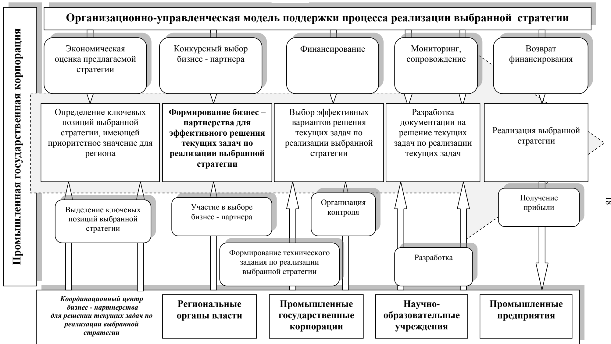
Рисунок 3 – Предлагаемое содержание организационно-управленческой модели поддержки решения текущих задач по реализации выбранной хозяйствующим субъектом бизнес-стратегии в рамках функционирования промышленной государственной корпорации на принципах бизнес – партнерства