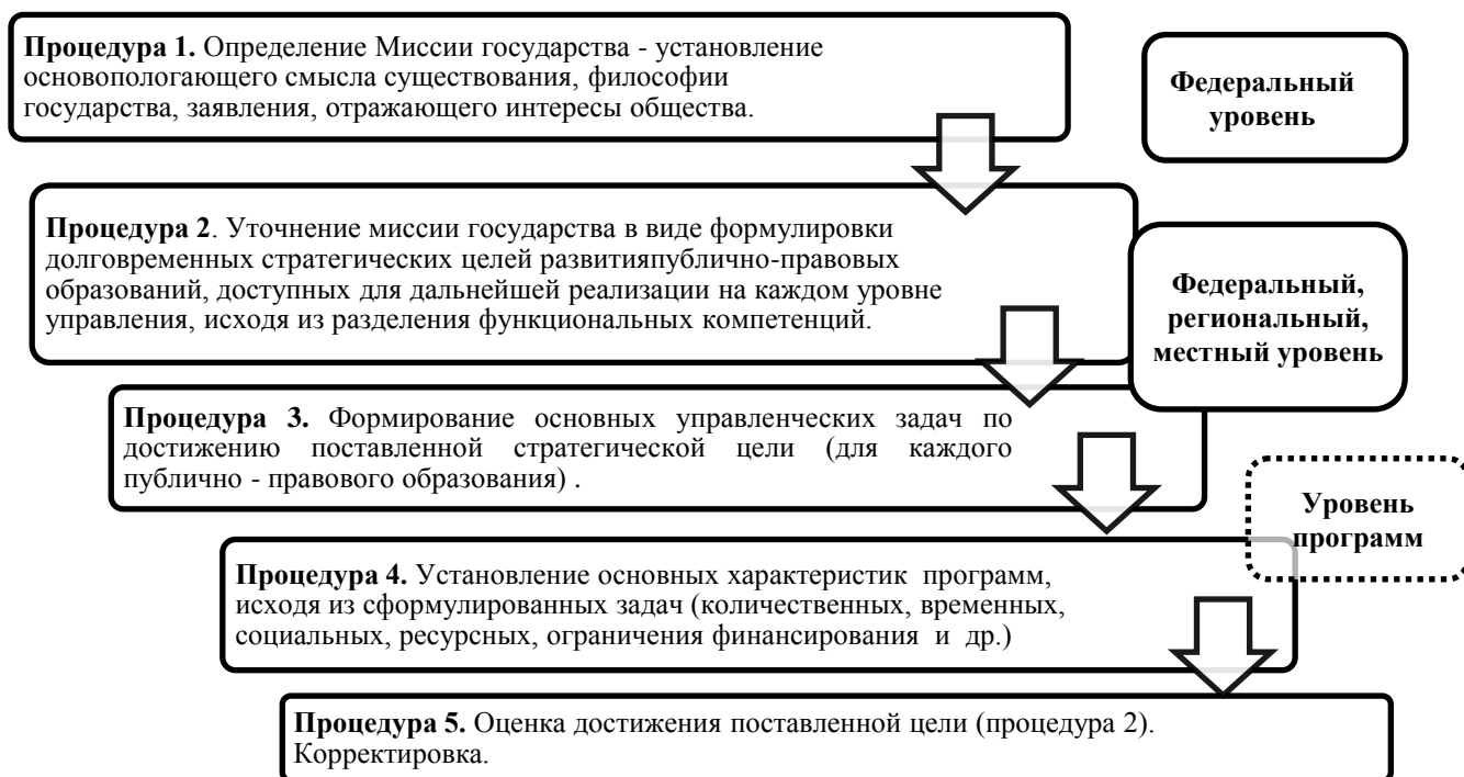
Рисунок 2 - Логическая цепочка достижения эффективности бюджетных расходов

Третья процедура посвящена разработке конкретных задач, направленных на детализированное обоснование способов достижения установленной стратегической цели развития государства и реализацию бюджетной политики, путем формирования собственных управленческих практик. Разработка задач носит комплексный и многоступенчатый характер, создает предпосылки для построения программного бюджета.