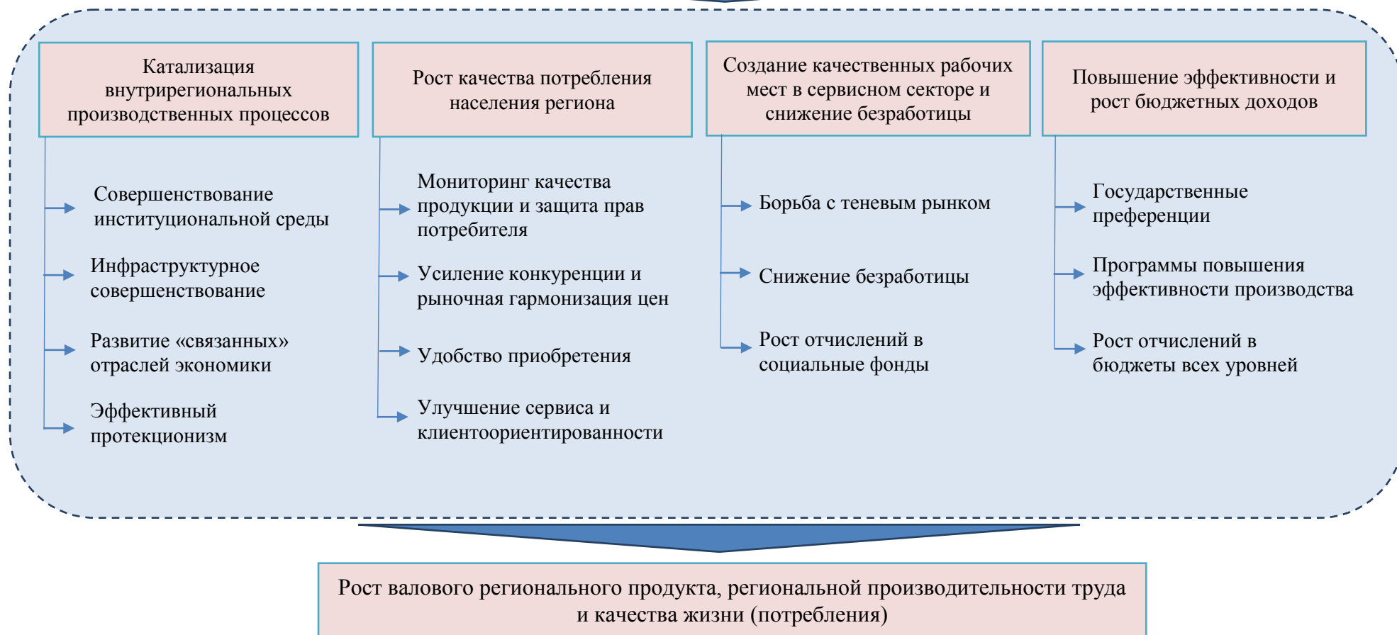
Рисунок 1 – Целевые ориентиры государственного регулирования локальных потребительских рынков