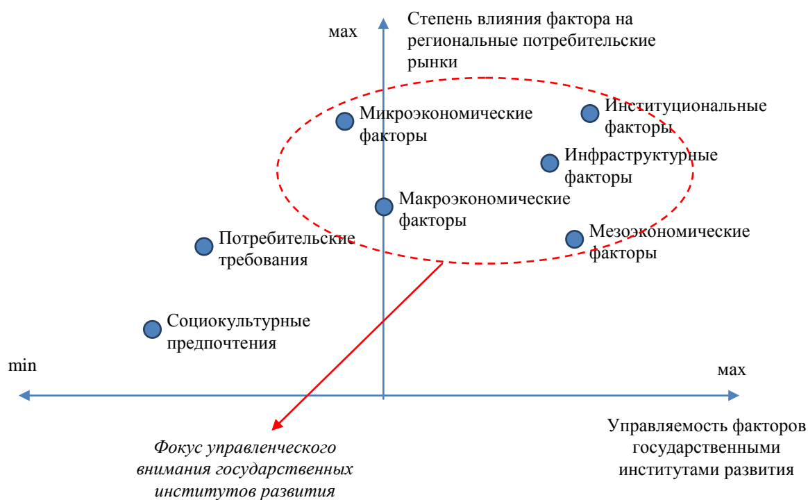
Рисунок 3 – Модель позиционирования факторов спроса в контексте разработки мер государственного регулирования регионального рынка мебели

Параметрическое позиционирование факторов предложения для оценки их влияния на рынок и меры государственного регулирования представлено на рисунке 4.