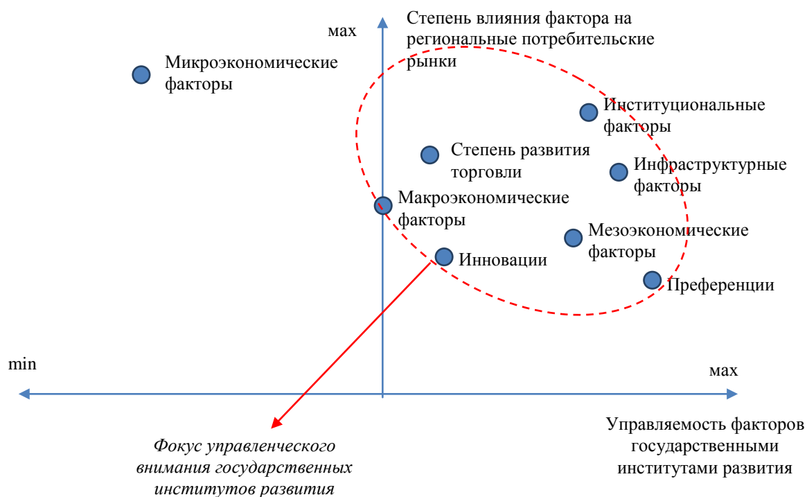
Рисунок 4 – Модель позиционирования факторов предложения в контексте разработки мер государственного регулирования регионального рынка мебели