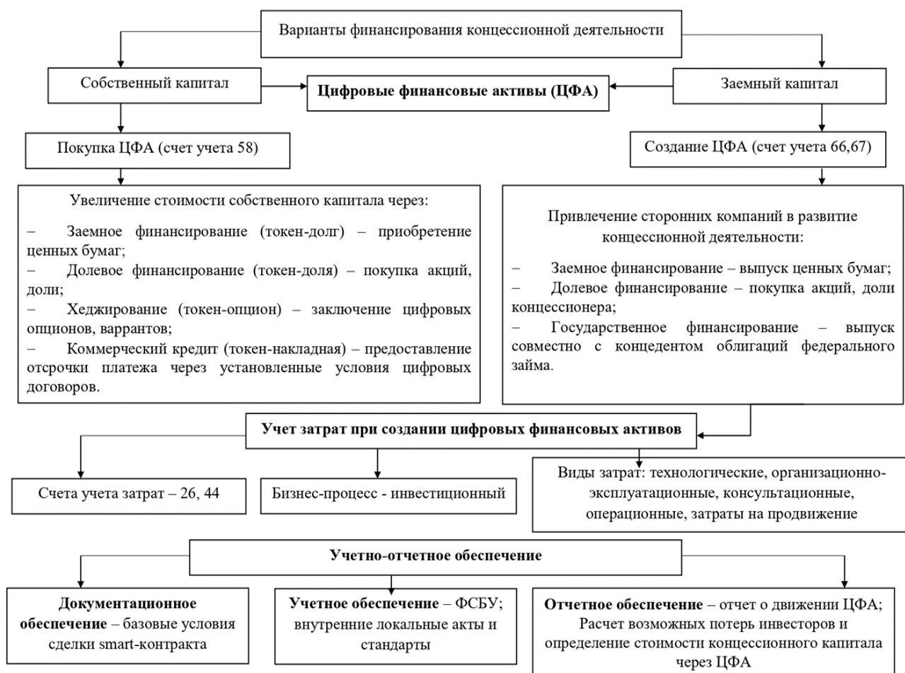
Рисунок 2 – Методический подход к бухгалтерскому учету формирования источников финансирования концессионной деятельности на основе цифровых финансовых активов

В процессе диссертационного исследования автором предложен методический подход к формированию бухгалтерского учета источников финансирования концессионной деятельности в рамках системы учетно-отчетного обеспечения на основе применения цифровых финансовых инструментов (Рисунок 2).