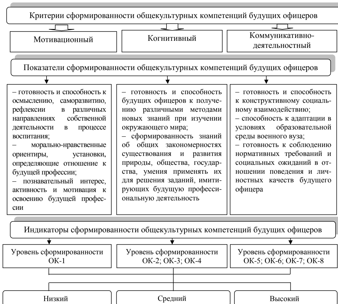
Рисунок 2. Критерии, показатели и уровни сформированности общекультурных компетенций будущих офицеров

компонентов конкретной общекультурной компетенции. Среднему уровню сформированности общекультурной компетенции свойственно в целом успешное, но не систематическое и/или содержащее отдельные пробелы применение соответствующих знаний, умений, навыков и опыта.