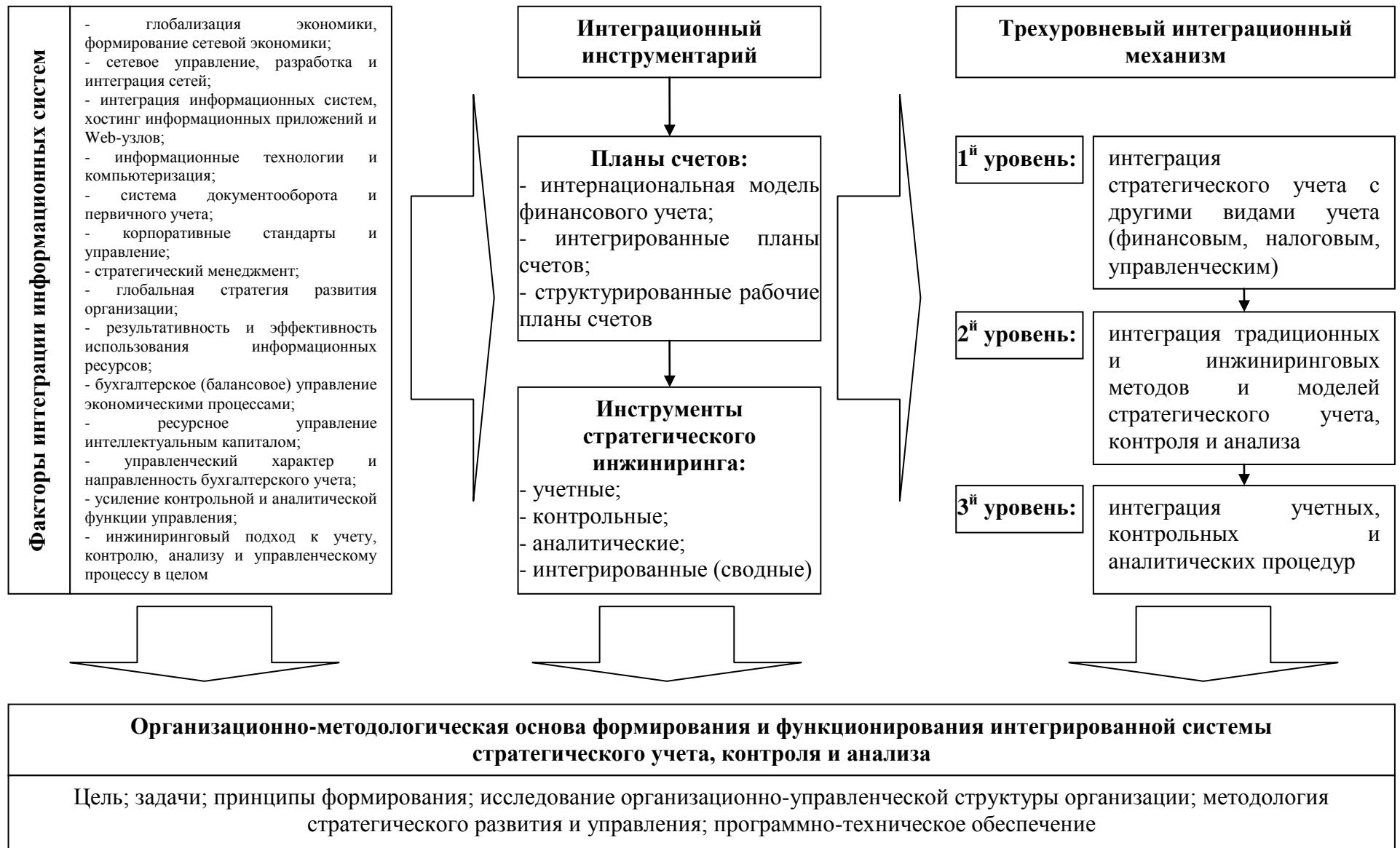
Рисунок 2 – Интеграционная модель учетно-контрольного и аналитического обеспечения стратегии развития организации