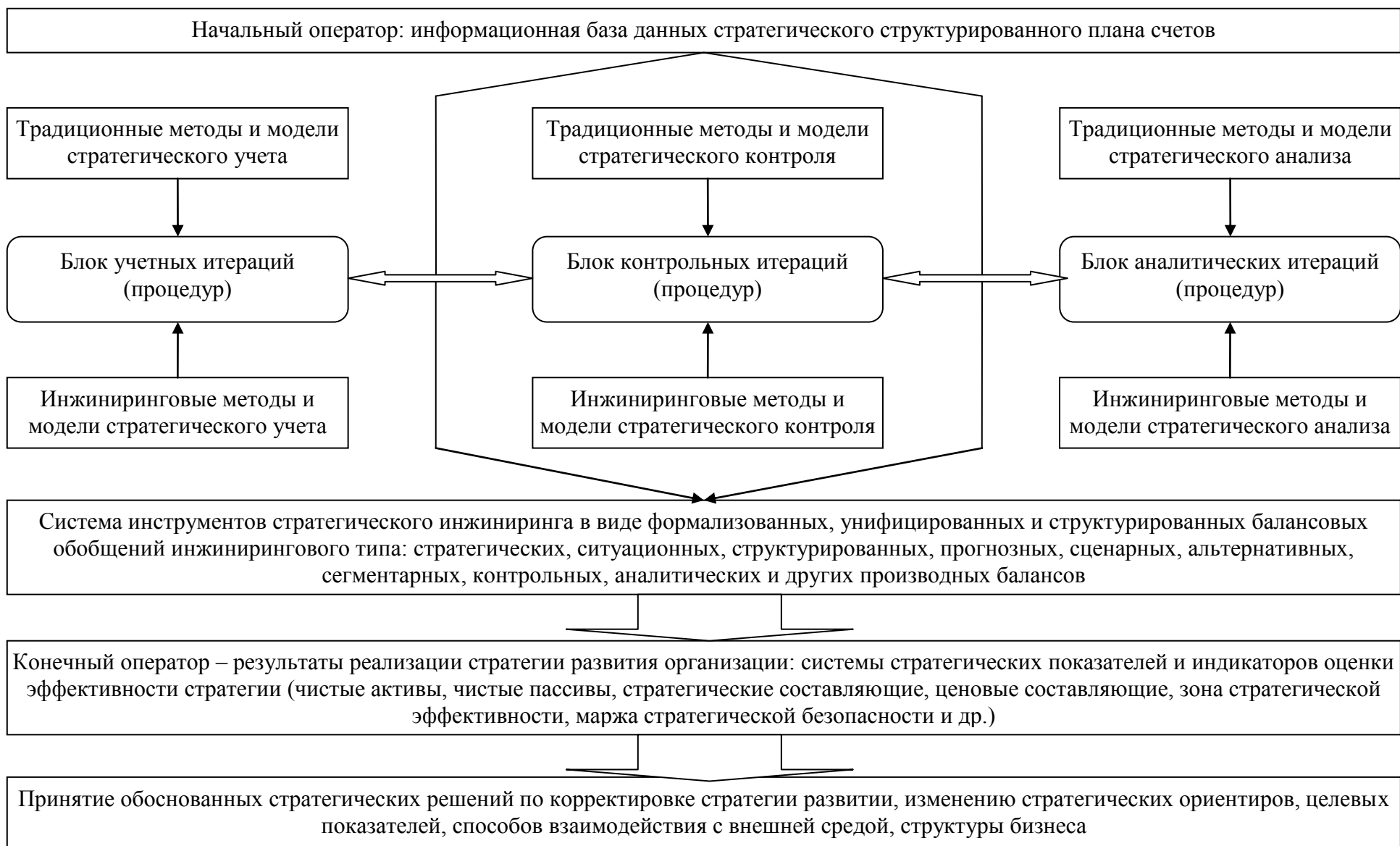
Рисунок 4 – Модель формирования и функционирования учетно-контрольного и аналитического инструментария стратегического инжиниринга