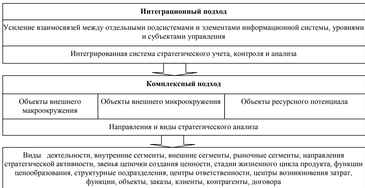
Рисунок 1 – Реализация комплексного и интеграционного подходов к стратегическому анализу

Обоснование стратегического анализа с позиций представленных подходов позволяет реализовать различные его направления и виды и выработать соответствующие методические рекомендации их организации и проведения: ситуационного, сценарного, прогнозного, факторного, фрактального, социального, инвестиционного, инновационного, портфельного, конъюнктурного, конкурентного, функционального.