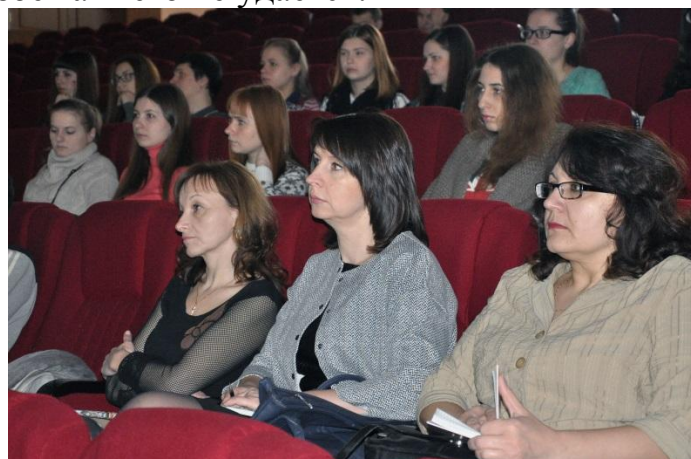
Участники семинара-тренинга «Управление конфликтами»

Участники семинара получили целостное системное представление о природе конфликтов и динамике их развития; научились диагностировать, и грамотно разрешать конфликтные ситуации; узнали способы профилактики конфликтов и методы управления эмоциональным состоянием, усвоили, что главное в любой конфликтной ситуации – умение сдерживать свои эмоциональную реакцию и постараться выявить истинную причину конфликта.