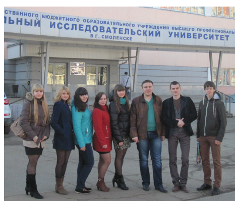
Участники Международной научно-технической конференции «Информационные технологии, энергетика и экономика»

Карачевский филиал Госуниверситета-УНПК представил шесть докладов в секциях «Научные исследования в области физической культуры, спорта, общественных